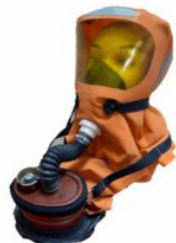
Самоспасатель изолирующий СПИ-20