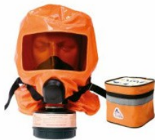
Газодымозащитный комплект ГДЗК-А