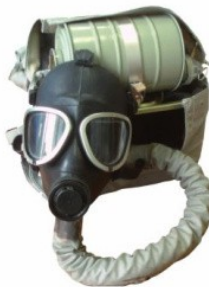
Противогаз изолирующий ИП-4М